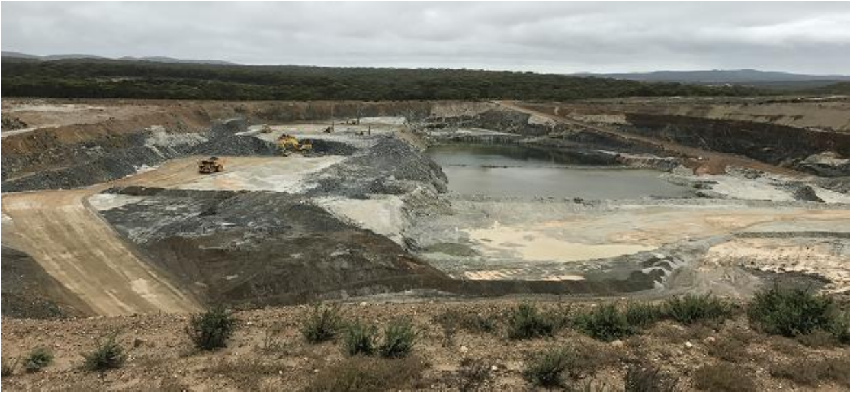
图表一、与银河锂业续签锂精矿承购协议